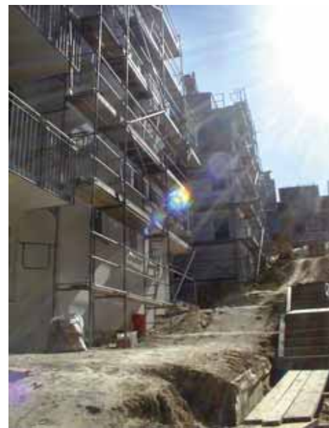
Fortsetzung von Seite 1

Braucht Klosterneuburg wirklich derartige Betriebe mitten in den Buchberg-Weingärten?