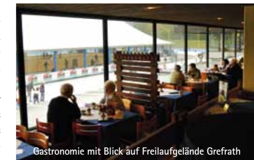
Gastronomie mit Blick auf Freilaufgelände Greifath

führt ( www.eisstadion.com ). Attraktiv und großräumig die Sportmöglichkeiten, perfekte ganzjährige Nutzung des Gebäudekomplexes für diverse (Groß und Klein)-Veranstaltungen, mit dem Effekt, dass das Eissportzentrum ohne die bei uns übli-