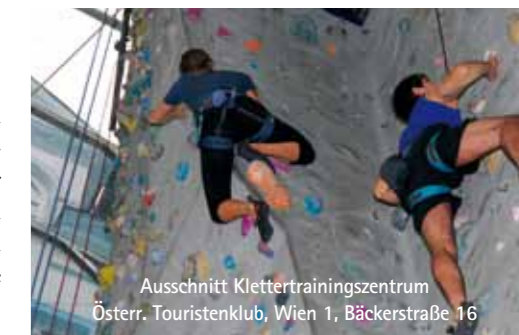
Ausschnitt Klettertrainingszentrum Österr. Touristenklub, Wien 1, Bäckerstraße 16

Ziel muss die Minimierung der Exposition der Bevölkerung mit Elektromagnetischer Strahlung sein – beim Handytelefonieren und durch Sender.