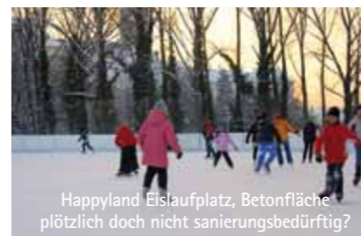
Happyland Eislaufplatz, Betonfläche plötzlich doch nicht sanierungsbedürftig?

Nur größere Lösungen werden die Attraktivität steigern.