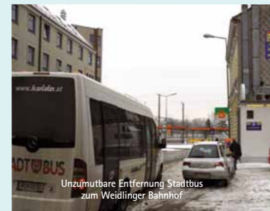
Unzumutbare Entfernung Stadtbus zum Weidlinger Bahnhof

Aufgrund einer Initiative der PUK gibt es nun für die Zonen 230B+100 bis max. 7 Tage ein kostenloses Ticket am Gemeindeamt zu entleihen. Reservierung mindestens 2 Tage vor der gewünschten Entlehnung telefonisch 02243/444-238. Alle Details unter: www.klosterneuburg.gv.at/gemeindeamt/download/221660802_1.pdf