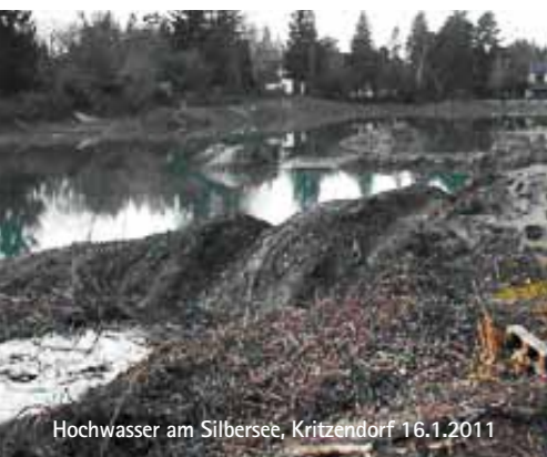
Hochwasser am Silbersee, Kritzendorf 16.1.2011

Mini-Erholungsgebiet Silbersee Opfer der finanziellen Interessen des Stiftes Klosterneuburg