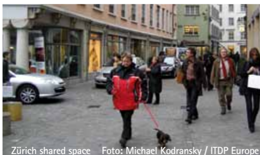
Zürich shared space

Gibt es jedoch diese Verkehrsleiteinrichtungen nicht, spielen etwa Kinder auf der Straße, finden Nachbarschaftstreffen auf diesem öffentlichen Raum statt, reagieren AutofahrerInnen instinktiv und unbewusst und vor allem richtig auf diese