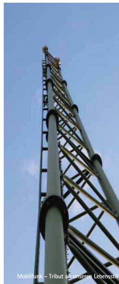
Mobilfunk – Tribut an unseren Lebensstil

Die Energiewende muss endlich gestartet werden. Packen wir es an!