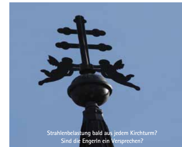
Strahlenbelastung bald aus jedem Kirchturm? Sind die Engerln ein Versprechen?

und AUVA) an Schulen und Kindergärten auszuhängen und vertrauensbildende Maßnahmen für die BürgerInnen umzusetzen. Leider findet derzeit