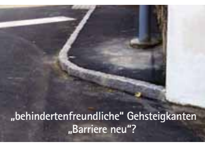
„behindertenfreundliche“ Gehsteigkanten „Barriere neu“?