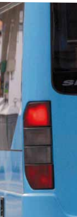
Wir fordern einen gut sichtbaren Anruf-Sammel-Taxi-Infopoint am Niedermarkt, Weidlinger Bahnhof und Rathausplatz, aber auch in Heiligenstadt mit – auch bei Dunkelheit – gut lesbaren Fahrplänen und eine übersichtlichere Darstellung des kompletten Öffi-Angebotes.